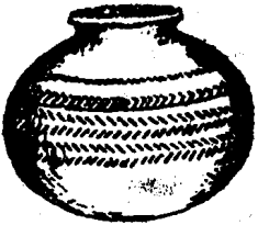
အိုးတုတ်

အိုးနင်းခွက်နင်း ကဝါ <O: nin: khwet nin> (喻) 混乱不堪: တချို့နိုင်ငံမှာအလုပ်လက်မဲ့ပြဿနာကြောင့် ~ ဖြစ်နေကြ၏။ 某些国家由于失业问题弄得混乱不堪。