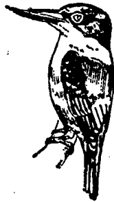
တိန်ညင်း

တိန်ညက် န၊ <tein: nyet> 【植】苏木(可做染料用) Caesalpinia sappan, Linn (sappanwood; brasiletto)