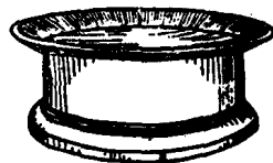
ခေါင်းလန်း

ခေါင်းလန်း န၊ <daun: lan:> 有底座的竹器大圆盘 (做饭桌用，见附图)