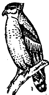
လင်းယုန်

လင်းယုန် နှ၊ <lin: yon> 【动】角鹰 Haematornis cheela burmanicus (The Burmese grested serpent eagle)