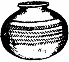
အိုးတုတ်

အိုးနှင်းခွက်နှင်း က၊ <O: nin: khwet nin:> (喻) 混乱不堪：တချို့နိုင်ငံမှာအလုပ်လက်မဲ့ပြဿနာကြောင့် ~ ဖြစ်နေကြ၏။ 某些国家由于失业问题弄得混乱不堪。