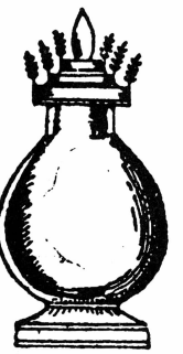
အိုးပျစ်

အိုးဝေ န၊ <O: wei> 孔雀的叫声：～ ဟူသောဥဒေါင်းတူနိသံ 孔雀“咕咕”的啼声