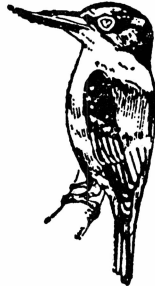
တိန်ညင်း

တိန်ညက် န၊ <tein: nyet> 【植】苏木(可做染料用) Caesalpinia sappan, Linn (sappanwood; brasiletto)