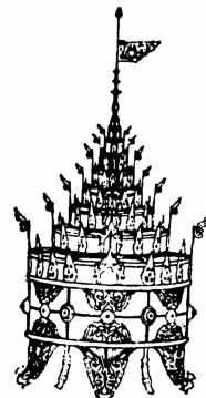
ထိ: I ④