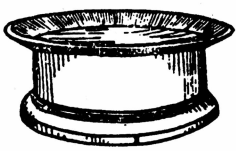
ခေါင်းလန်း

ခေါင်းလည်ဆစ်ထ က၊ <daun: le zit hta'> 倒伏的稻 子、稻穗又挺立起来