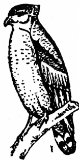
လင်းယုန်